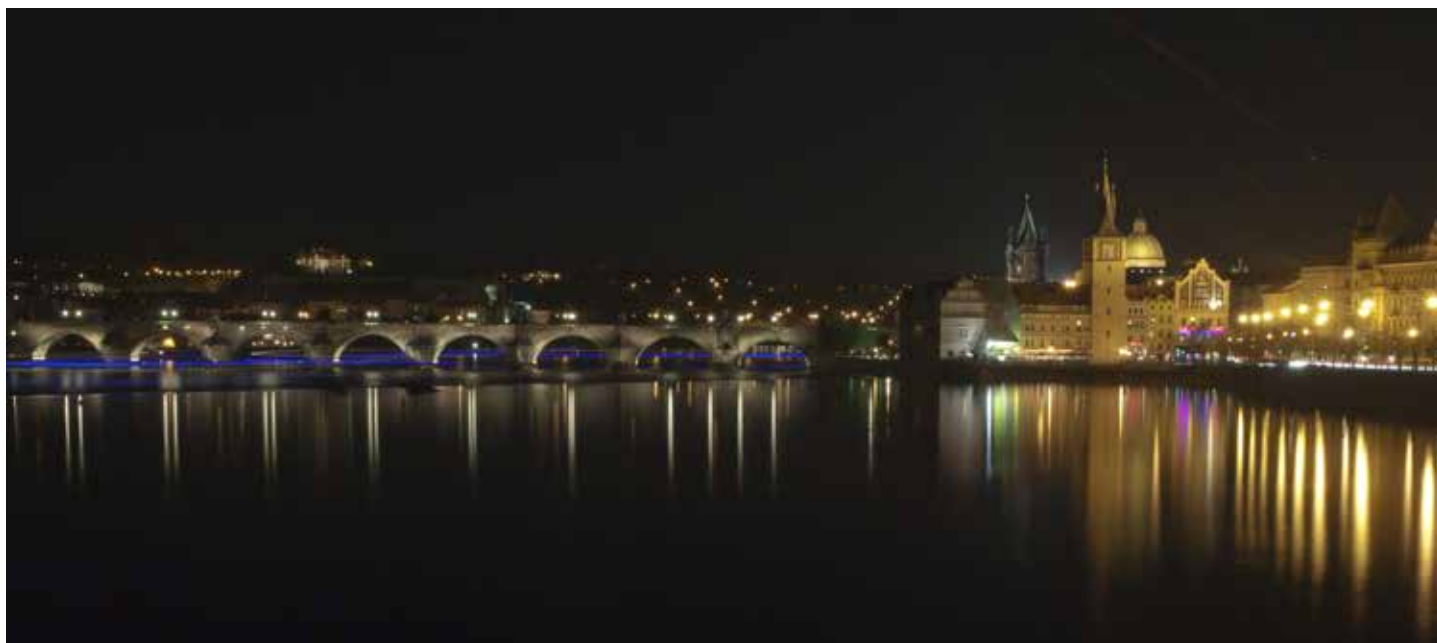
Exponováno extrémně dlouhým časem 362 s (F18, ISO 100, f = 30 mm).