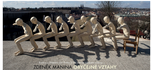
Bastion o Městská část Praha 2 Vás zve na zahájení výstavy ZDENĚK MANINA OBYČEJNÉ VZTAHY

v pondělí 30. 3. 2015 v 18 hodin v areálu Bastion XXXI u Božích muk,