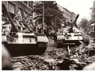
Fotografie z pozvánky na výstavu Nejdelší noc - 21. srpen 1968