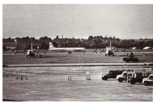
Fotografie z pozvánky na výstavu Nejdelší noc - 21. srpen 1968