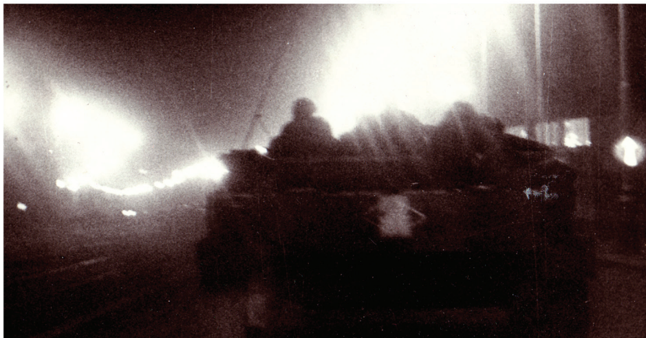
Fotografie z pozvánky na výstavu Nejdelší noc - 21. srpen 1968

nás nejvíce zaujaly fotografie, z nichž mnohé jsou vystaveny zcela poprvé. Muzeum Policie ČR v Praze 2, Ke Karlovu 453/1 má otevřeno od úterý do neděle od 10 do 17 hodin, pondělí je zavřeno. Vstupné: dospělí 30 Kč, děti, studenti, důchodci 10 Kč (odpoledne pro děti 5 Kč) a rodinné vstupné 50 Kč. Více na webu MuzeumPolicie.cz .