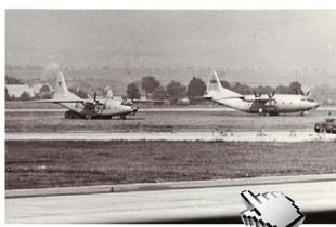
Fotografie z pozvánky na výstavu Nejdelší noc - 21. srpen 1968